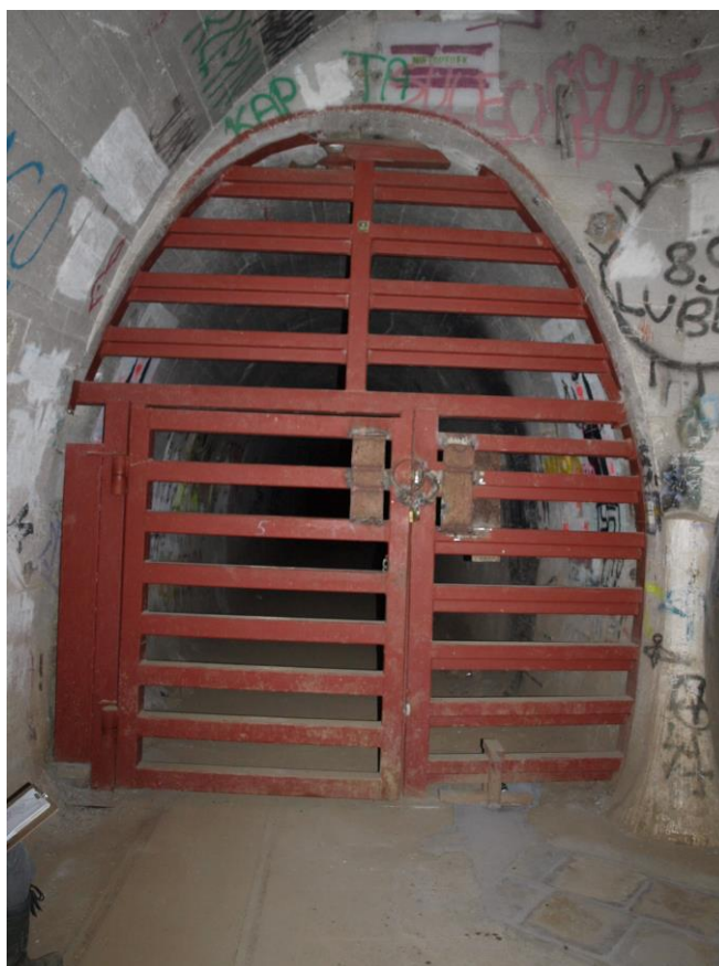
zdj. 3 – Widok na istniejącą kratę od strony dworca.