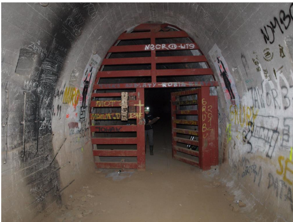
zdj. 5 – Widok na kratę od strony korytarza.