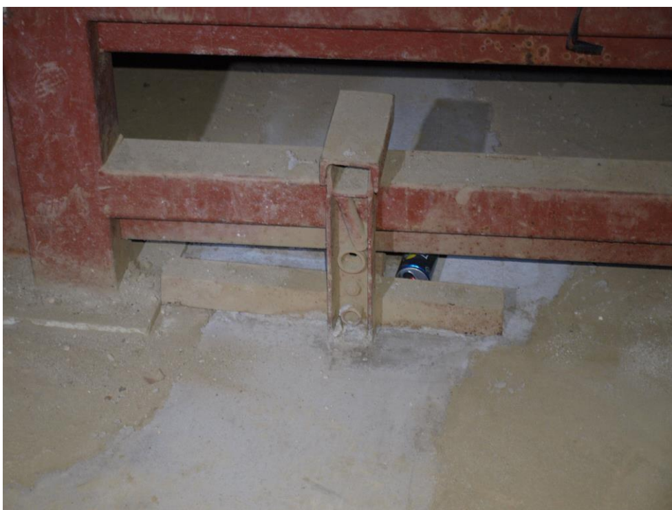
zdj. 6 – Dodatkowe wzmocnienia kraty.