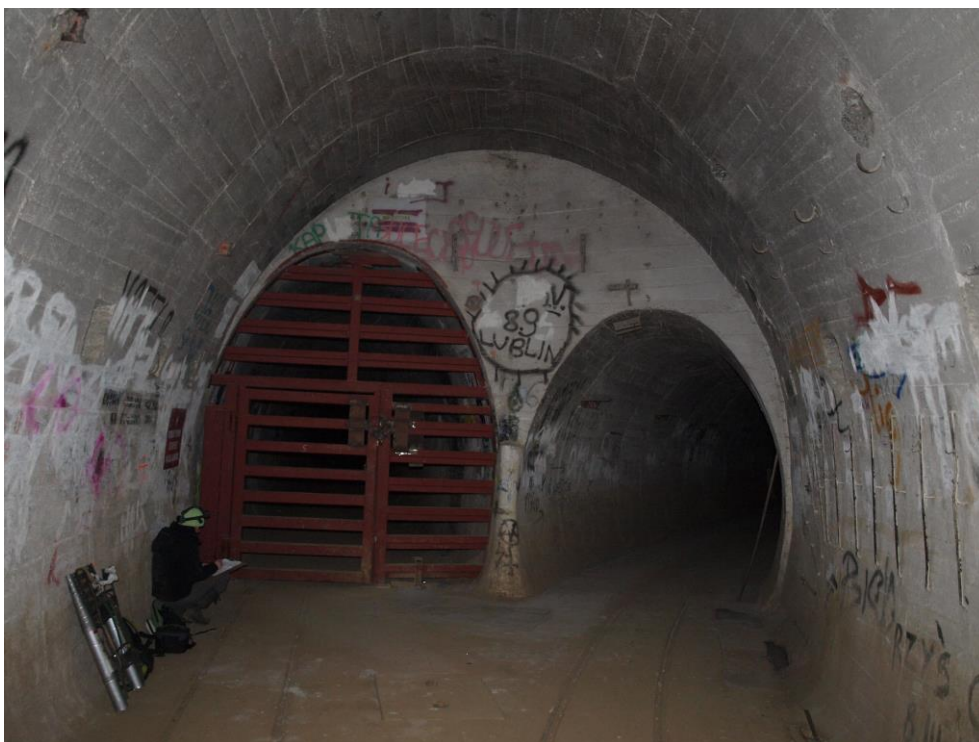
zdj. 2 – Widok na korytarz – stan istniejący.