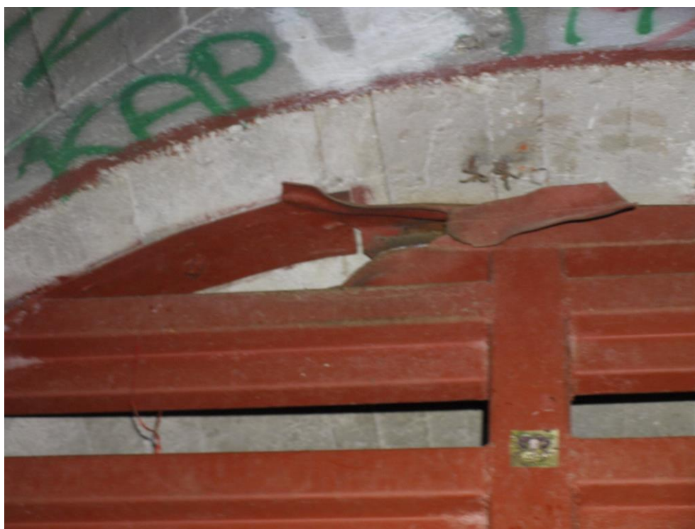
zdj. 5 – Uszkodzenia powstałe w wyniku włamywania się do obiektu.